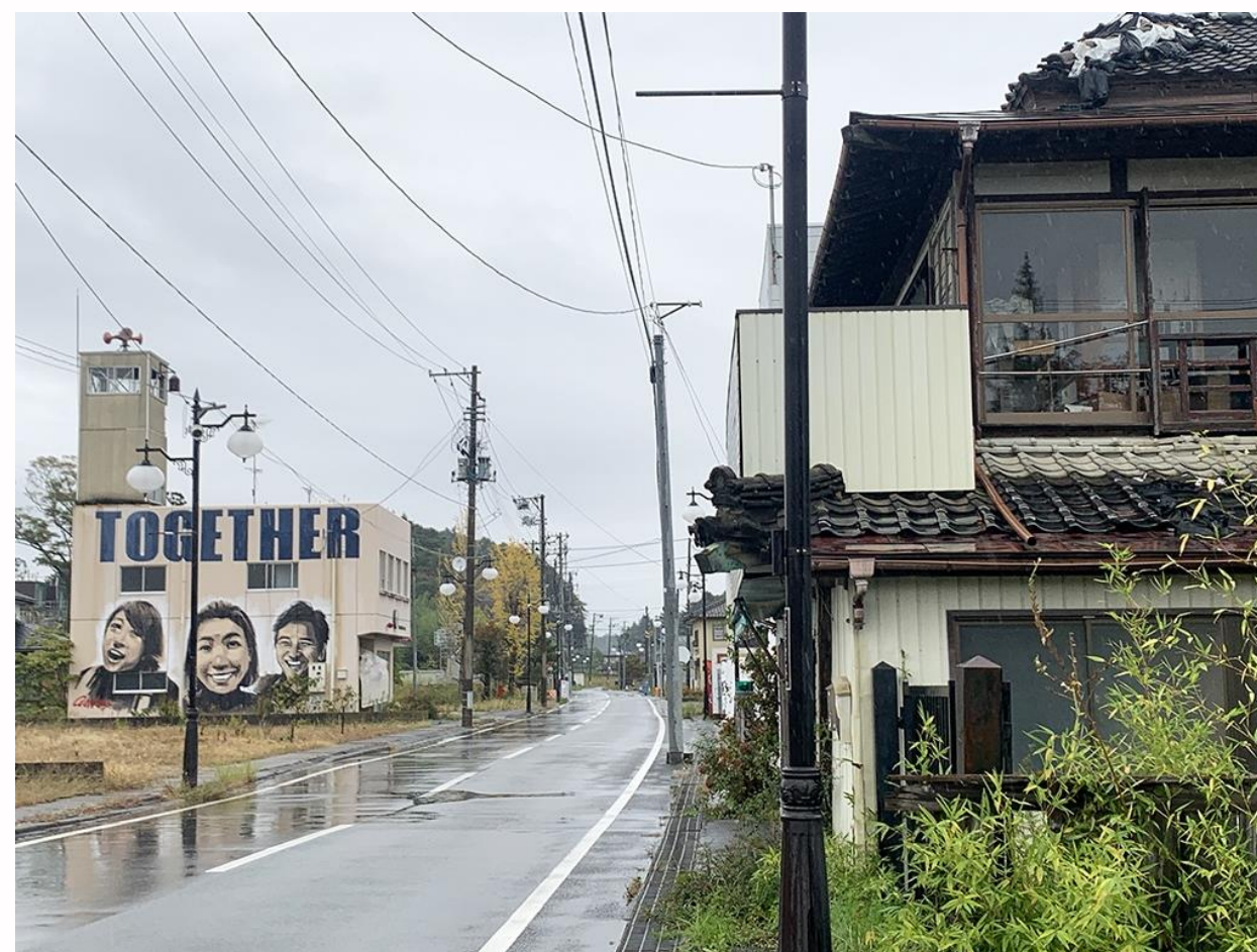
壊されていない家