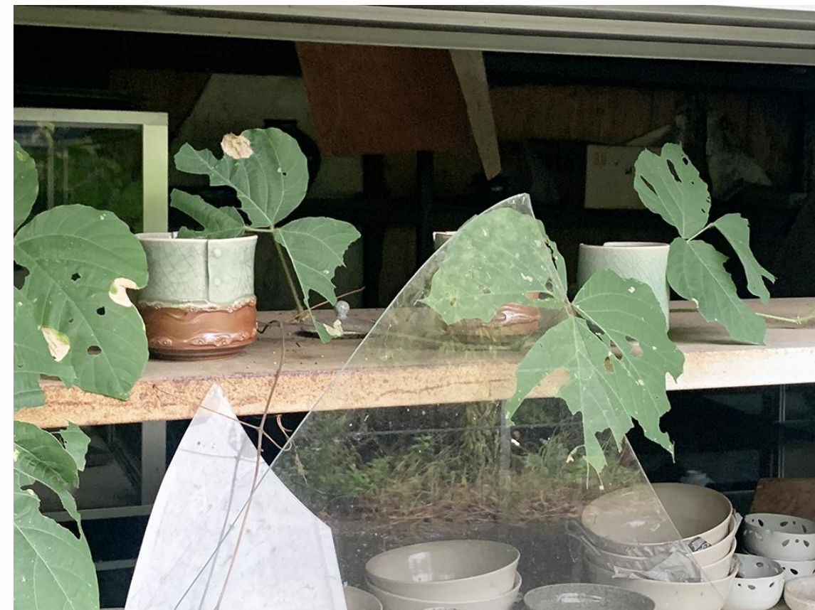
そのままになっている 工房