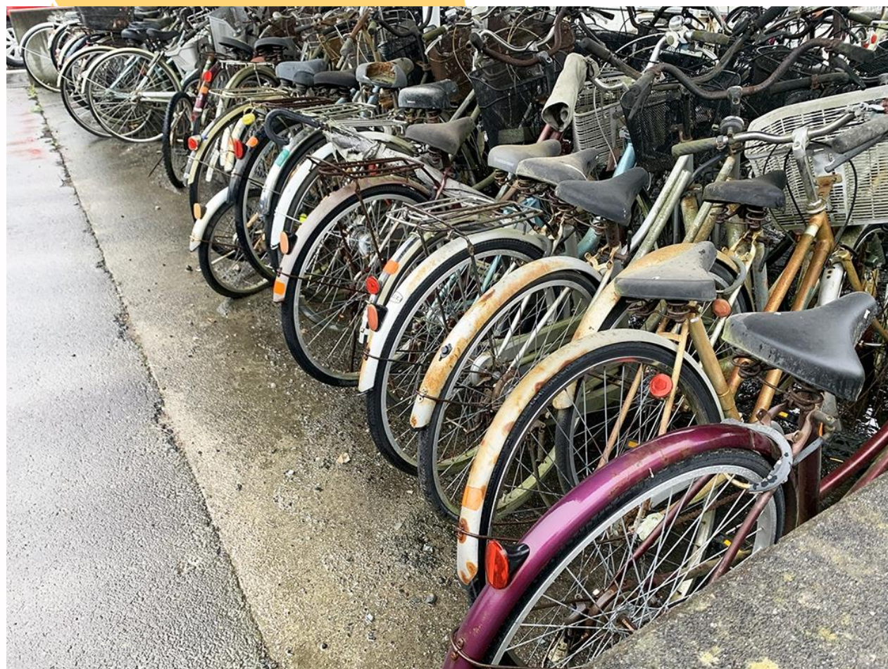
そのままになっている 駅近くの自転車置き場